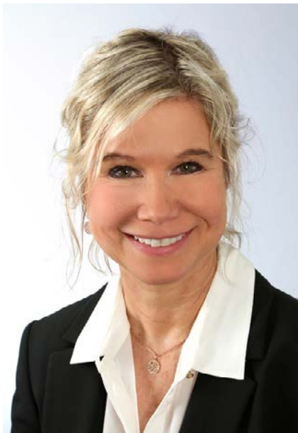
Autor: Nina Baiker, Stv. Leitung PK-Beratung

Der «Dynamische Pensionskassen-Vergleich» der Assurinvest AG ist ein Praktiker-Tool, welches einen aussagekräftigen Benchmark für firmeneigene Stiftungen generiert. Der Ergebnisreport weist das relative Stärken- und Schwächenprofil der Stiftung im branchenübergreifenden Vergleich aus.